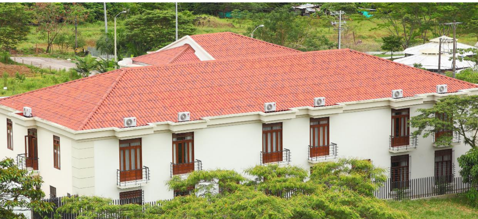
Casa Dominica Fray José. Villavicencio, Meta, Colombia