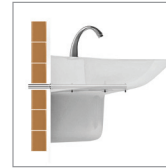
Mamposteria ó Concreto