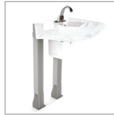
Drywall ó Madera

Los soportes para lavamanos FREE y AQUAJET cumplen con las normas ASME A112.19.2-2008/ CSA B45.1-08 y la norma NTC 920 (ICONTEC), soportando un peso mínimo de 250Lbs, permitiendo darle al usuario una seguridad completa al momento de utilizar estos lavamanos.